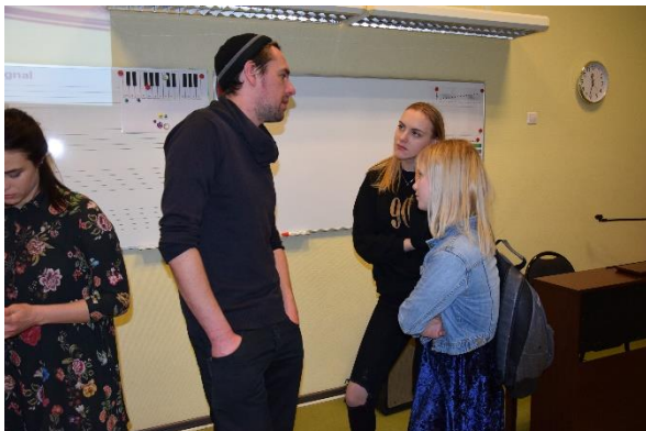
Latvijas skolas somas aktivitāte 8. klasēm „Kas ir teātris?”