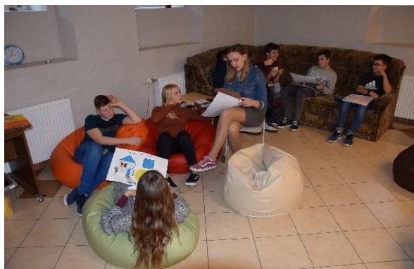
Literatūras stunda 8.b klasei skolas pagrabiņā: A.Čaka dzejas performance.