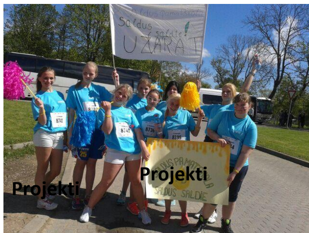
7.b klases priecīgās meitenes