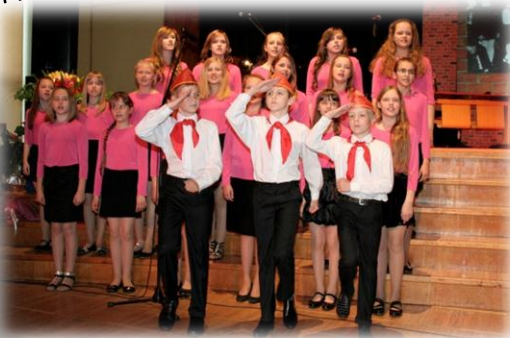
Vēsturē bija arī tā...