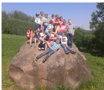
2.b klase iepozē uz Velnakmens

Ekskursijā uz Talsu pusi devās 2.a un 2.b klase. Apmeklējām Abavas rumbu, uzkāpām Sabiles Vīna kalnā, bijām pie Velnakmens un Velnalas, ēdām gardas pankūkas Rideļu dzirnavās un paraudzījām, cik silts ūdens ir jūrā pie Engures. Diena bija gara un ļoti karsta, tāpēc mājās atgriezāmies noguruši, bet ar sārtiem vaidziņiem. Novēlam ikvienam sajūst kopību un piedzīvojumu garšu, braucot jaukās ekskursijās!