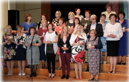
Skolas darbinieki svētkos