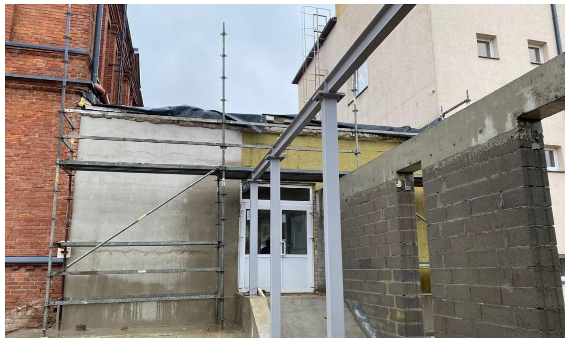
Celtniecības process 2021.gada novembrī