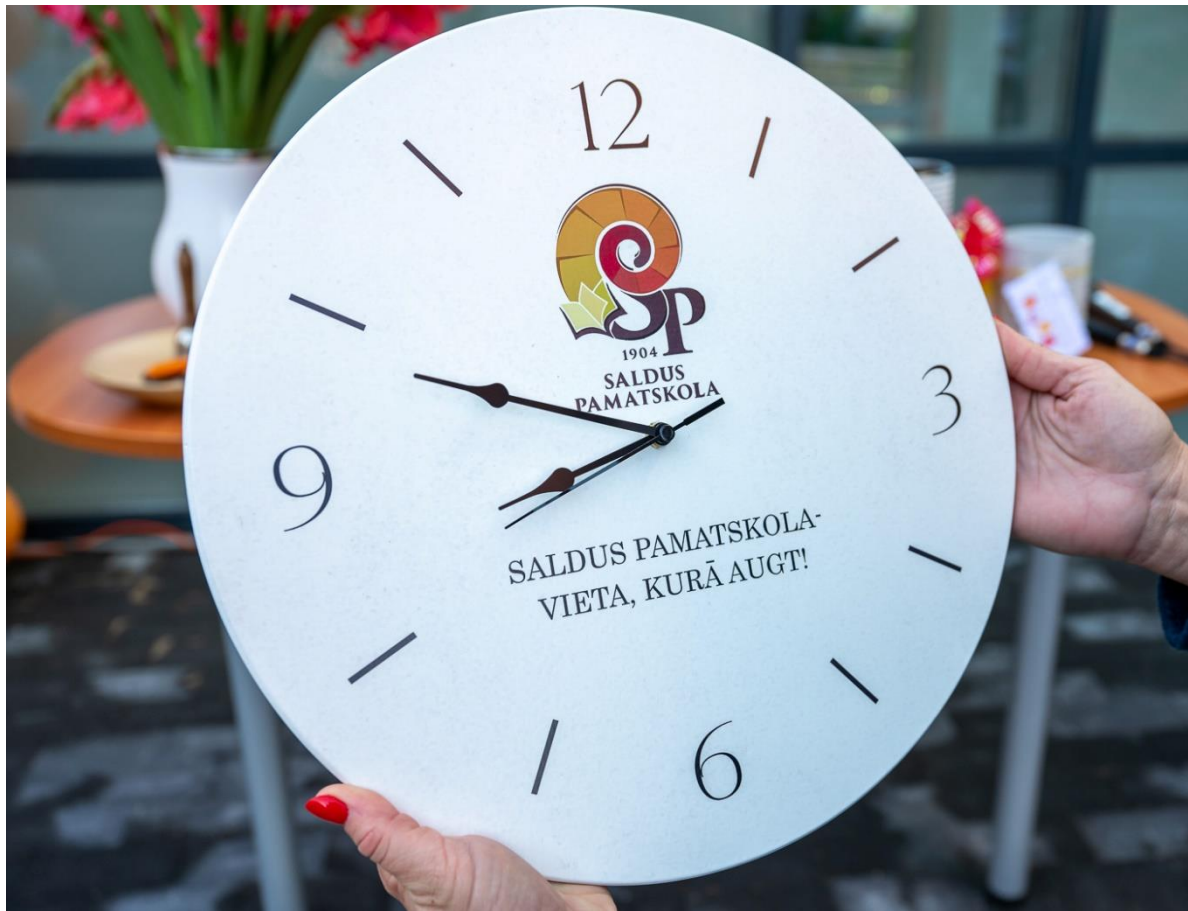
2022.gada 1.septembris- skolas jaunās ēkas atklāšana